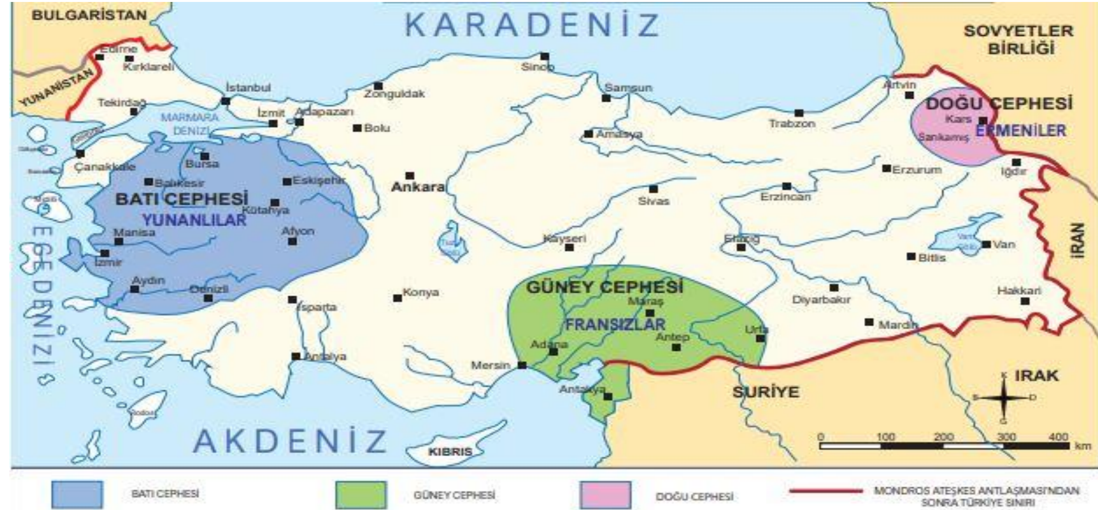
Milli Mücadele Cepheler Haritası